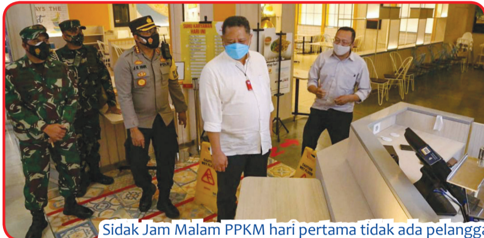
Sidak Jam Malam PPKM hari pertama tidak ada pelanggaran berarti, karena pusat perbelanjaan tutup sesuai aturan

Kami berikan peringatan, dan berikutnya bangku itu