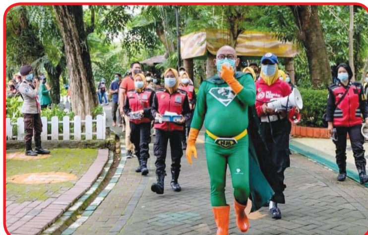
Superhero New Man sosialisasikan protokol kesehatan di tempat wisata Kebun Binatang Surabaya.