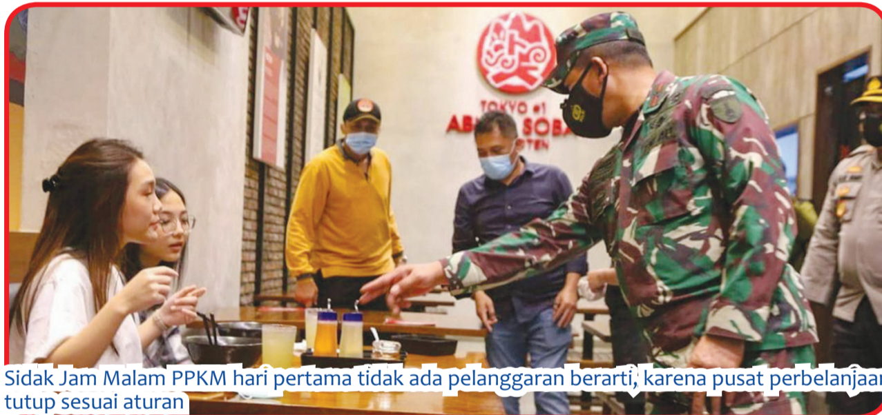
Sidak Jam Malam PPKM hari pertama tidak ada pelanggaran berarti, karena pusat perbelanjaan tutup sesuai aturan

“Nantinya, setiap pembatasan di pintu masuk kota Surabaya akan dilakukan sterilisasi. Serta dilakukan penjagaan oleh petugas gabungan TNI, Polri serta Satpol PP Kota Surabaya. Pengecekan juga dilakukan