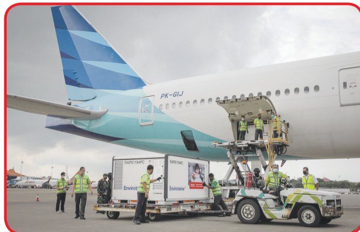
Petugas menurunkan kontainer berisi vaksin Covid-19 saat tiba di Bandara Soekarno-Hatta, Tangerang, Banten.

JAKARTA (IM) - Sebanyak 15 juta dosis vaksin Covid-19 buatan perusahaan farmasi Sinovac, Tiongkok, Selasa (12/1) sore kemarin tiba di tanah air.