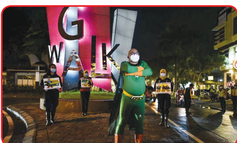
Superhero New Man di depan landmark GWalk Citraland Surabaya saat sosialisai prokes

Menurut pemeran Superhero New Man yang tidak lain adalah Camat Sawahan