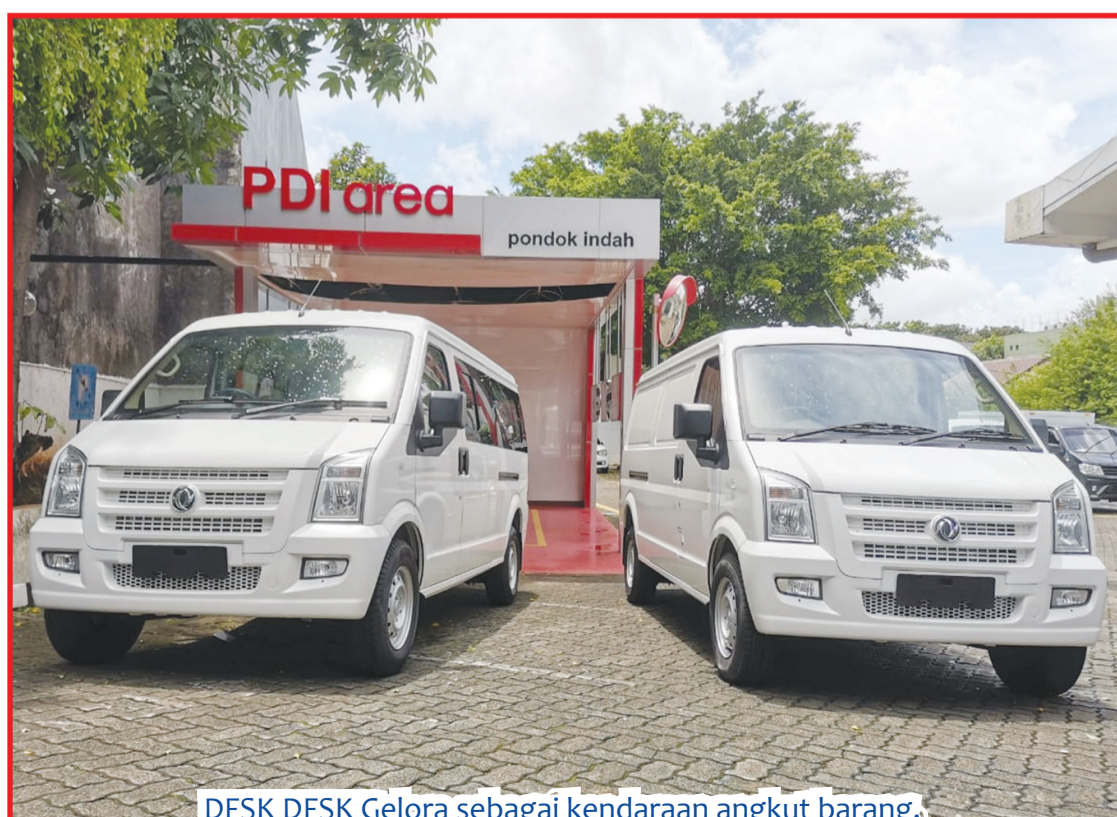
DFSK DFSK Gelora sebagai kendaraan angkut barang.

Konsumen jangan sampai ketinggalan memanfaatkan penawaran menarik dan luar biasa ini karena penawaran ini berlaku hingga 31 Januari 2021,"pungkas Riccy. • bam