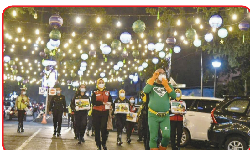
Superhero New Man sosialisasikan protokol kesehatan di kawasan Gwalk Citraland Surabaya

gang di sana mayoritas suku Madura,” tambahannya.