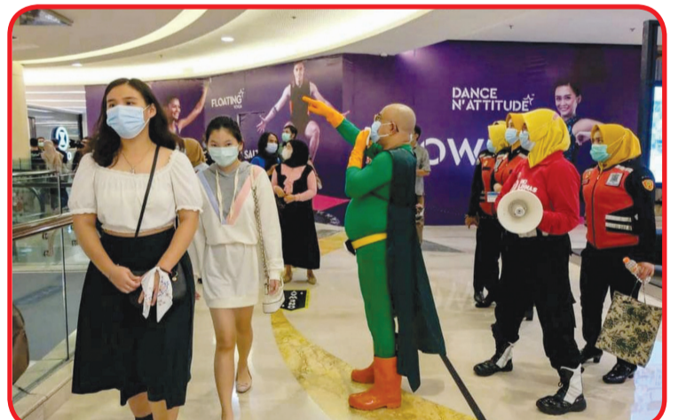
Superhero New Man sosialisasikan protokol kesehatan di kawasan mall dan pusat perbelanjaan Surabaya.

hijau menyerupai Superman, ia blusukan ke sejumlah kawasan untuk mengingatkan masyarakat agar mematuhi protokol kesehatan.