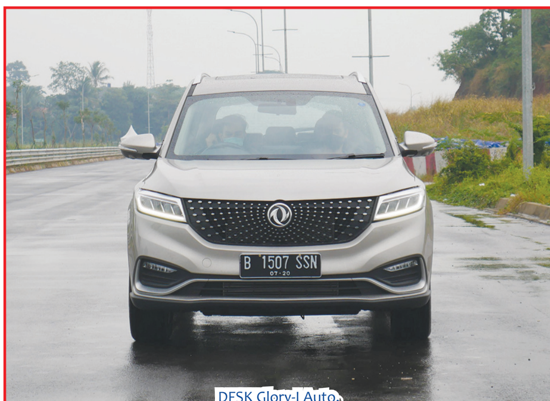
DFSK Glory-i Auto,